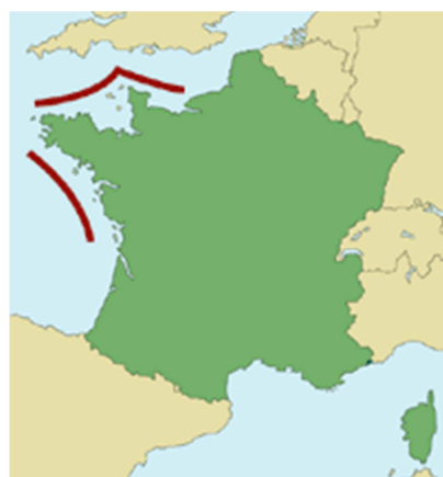
Zones de pêche